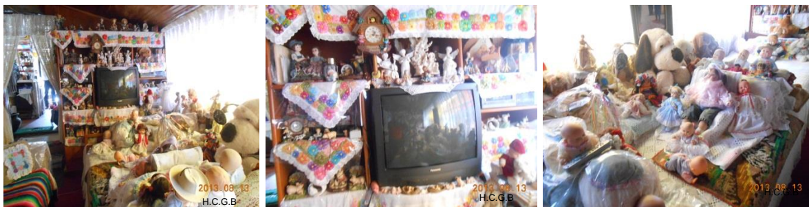
Sala de la Sra. Mercedes decorada con muñecas

Si usted la visita es una señora muy alegre risueña que trata muy bien a sus clientes para que conozca su casa que tiene casi como si tuviera un museo de muñecas las cuales tiene distribuidas en recamaras, baños, pasillos, en la cocina , sobre todo en la sala y que quisiera más espacio para poner más.