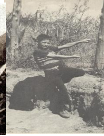
Niño en la calle de Ocioso

A las 8:00 hrs pm se daba el toque de las ánimas; que consistía en rezar una oración por las ánimas del purgatorio.