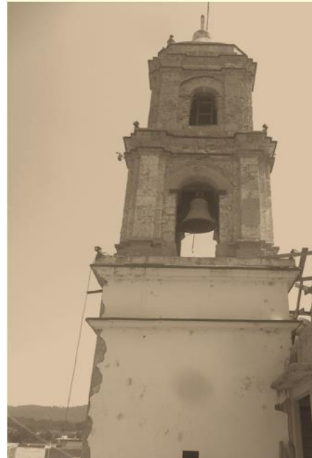
Torre San José Malacatepec

Las primeras campanas de esta parroquia de San José fueron fundidas en 1771, estando al frente de esta parroquia el párroco José Manuel Escutia quien duro 17 años cuando el llego fue en el año 1788, las campanas no sólo se usaban para llamar a los feligreses a sus ejercicios religiosos, sino que también los ayuntamientos de aquel tiempo tenían establecido lo siguiente: a las 8:00 horas am se tocaba una campana que servía de señal o contraseña a los niños de edad escolar, para que fueran a la escuela y las 12:00 horas pm servía para la salida, así como también para los trabajadores y obreros del campo como aviso que ya era el medio día los cuales se quitaban el sombrero al escuchar las campanas, y que por cierto sacaron un dicho grosero para esta hora, que decían entre ellos las doce dijo un obrero chinge a su madre el que no se quite el sombrero, así como también era la hora de rezar el Angelus que consistía en decir el ángel del Señor anuncio a María y concevio por obra del espíritu santo y se rezaba un ave María.