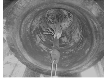
Badajo campana mayor