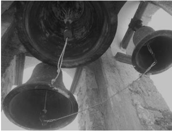
Sonido con las 3 campanas