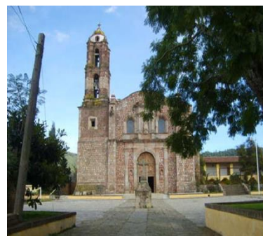
Parroquia de la Asunción

La parroquia de San José Malacatepec, es la única que conserva el nombre original de este pueblo, “Malacatepec”, hoy San José Villa de Allende, es un municipio que pertenece al Distrito de Valle de Bravo, Estado de México, el lugar que ocupa es envidiable porque es un valle rodeado de montes, cubierto de cedros y ocotes y por su suelo corre un río grande llamado San José, así como varios arroyuelos formados de manantiales que nacen en las barrancas.