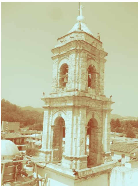
Jubo, parte de madera que sirve para colgar la campana

La copa es de bronce, fundida con diversas aleaciones, como son: metal y bronce como mencionaba anteriormente la nuestra tiene un poquito de oro.