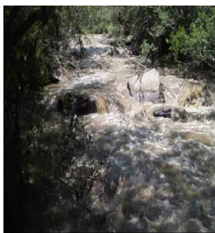
Rio San José