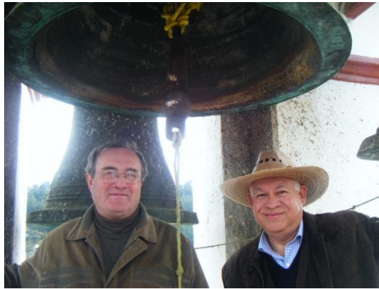
Esta campana se escucha un poquito más de un kilómetro

Algunas campanas son celebres por su tamaño , por su valor o por la distancia que se escucha su teñido; la de San José es por su tañe o mejor dicho tañía ya sea por su aleación que tiene de bronce con oro aunque sea poco se escucha perfectamente aún poco más de un kilómetro a la redonda y sobre todo muy diferente a la de los pueblos que mencionamos anteriormente y que pertenecen a esta parroquia, lo que si no sabemos si las primeras campanas fueron fundidas aquí o las trajeron de algún lado, también existe una campana chica en la parte de atrás de la bóveda, que avisa cuando está temblando y con los movimientos toca sola, así como también las campanas del campanario sobre todo las dos chicas han llegado a tocar con los temblores, estas campanas fueron visitadas para conocerlas el Señor Sergio Serguei Fockine, de origen ruso y por el doctor Rafael Ariceaga Paredes del Estado de México quienes subieron el campanario. 8