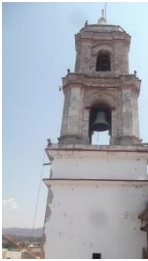
Torre del siglo XVII