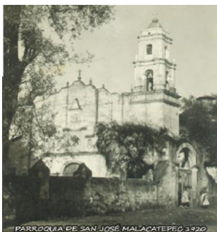
Parroquia de San José Malacatepec