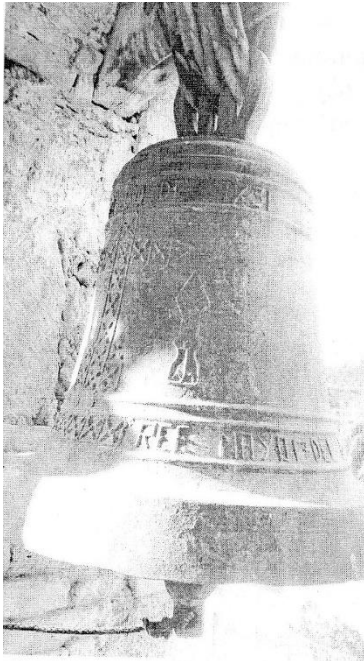
Campana de San Ildelfonso 1731

Quiero hacer mención que las campanas del pueblo de San Ildelfonso perteneciente a esta parroquia su campana es el año 1731 mas antigua que las de San José.