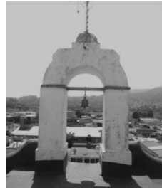
Campana que suena cuando tiembla