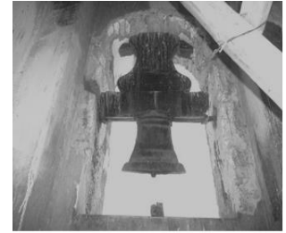
Esquila en el cupulin

También hay técnicas de campanas y con toques muy raros. Por ejemplo, donde hay sólo dos campanas, como es el caso de los pueblos pequeños se repica con una sola cuerda en cada mano, para repicar cuando hay tres campanas se utilizan tres cuerdas a cada badajo correspondiente, cuando hay cuatro campanas la cosa es más sencilla por que salen más notas musicales y aunque estas son mas complicadas, en el arte de los repiques de las mismas; porque estas, el campanero tiene que tener sujetas en ambas manos, una cuerda que lleva a otras dos, y tocan a su ritmo las cuatro a la vez.