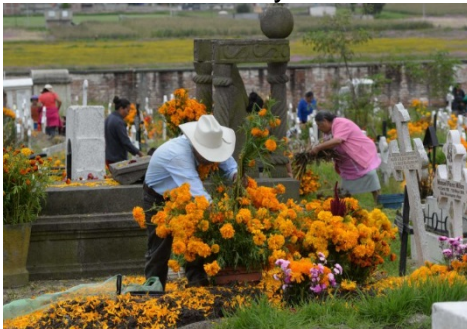
Mazahuas arreglando sus panteones

Entre los días 1 y 2 de noviembre, los panteones de nueva cuenta estarán engalanados con atuendos multicolores para la ocasión, en México el cempasúchil en vara o desojado sobre la tumba acompañan a los dolientes a recordar quienes ya no están con nosotros. Su diversidad es extensa, pues existen 30 variedades del cempasúchil la cual recibe distintos nombres como: flor de muerto, flor de cempoal, flor de niño o 20 pétalos.