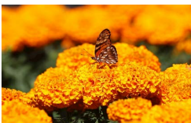
Flor de cempasúchil

Por: Héctor Cruz González Bejarano Cronista Municipal de Villa de Allende