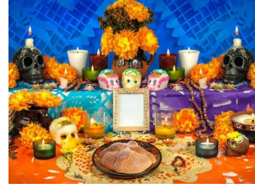
Ofrenda de muertos

El significado que tiene esta bonita flor en las ofrendas de nuestros antepasados creía que el cempasúchil guardaba los rayos del sol, estos eran utilizados para alumbrar el camino de los muertos, razón por la que se utilizaban en los altares, ofrendas y entierros dedicados a sus muertos. Con ellas se forma un camino desde la entrada del domicilio hasta el sitio donde se encuentra la ofrenda. (1)