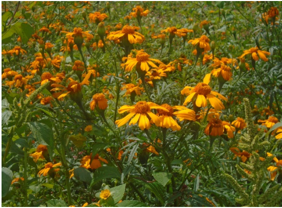
Sembradío el Aventurero

Allende, acostumbran a sembrarla una vez que esta ya creció, posteriormente; la cortan y la dejan que se pudra sobre la tierra.