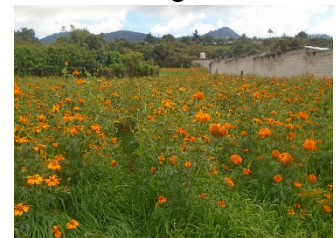
Sembradío de flor de cempasúchil en San Jerónimo Totoltepec

Principales productores sobre todo el estado de Puebla es el que produce más que Oaxaca, Guerrero, Hidalgo, Michoacán, Morelos, San Luis Potosí, Tlaxcala y Durango. En el municipio de Villa de Allende, Estado de México, existen algunas comunidades como: San. Jerónimo Totoltepec, San. Pablo Malacatepec, San. Ildfonso, Los Hoyos, Vare Chiquichuca Barrio de San Miguel que se han dedicado a la siembra de esta flor de cempasúchil aunque sea en baja producción, utilizan una parte para su consumo y la otra parte para venderla en el tianguis, en el mercado y en el panteón municipal de San José Villa de Allende, así como en otros municipios.